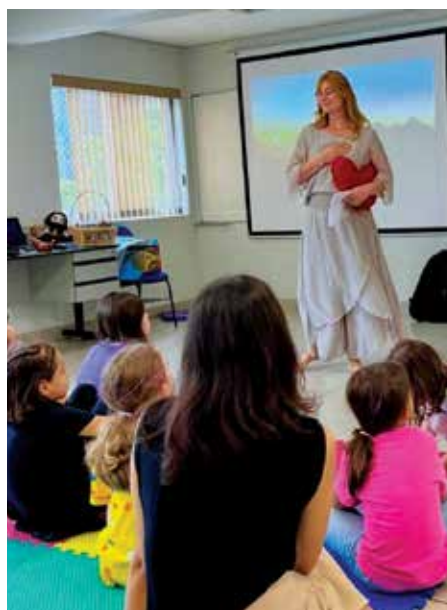
Imagem do arquivo da evangelização infanto-juvenil

É assim que na Nossa Casa, o IEE, a evangelização infantil é direcionada na