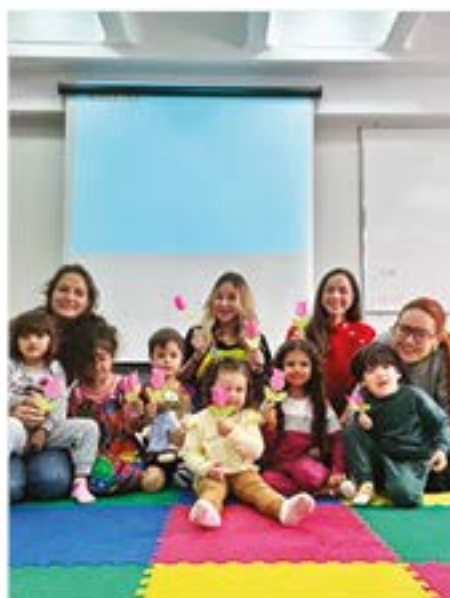
Imagem do arquivo de evangelização infanto-juvenil

Esses conceitos precisam ser adequados à uma linguagem pedagógica conforme a faixa etária das crianças e jovens. Esse é o principal desafio do evangelizador espírita, traduzir os ensinamentos, por vezes de difícil compreensão em uma linguagem lúdica, concreta e dinâmica. Por vezes, utilizamos as manifestações artísticas, para nos ajudar nesse propósito, tais como: a música, desenhos, pinturas, e teatros de fantoches e de varas para contação de histórias. Buscamos seguir a orientação de Kardec, nos comentários à resposta da questão 917 do O Livro dos Espíritos: "Essa arte (educação), porém, exige